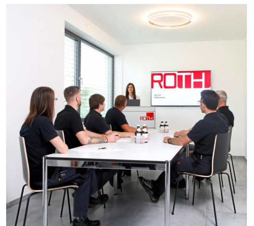
Die Firma Roth stellt Brandschutzbeauftragte, bildet Brandschutz- und Evakuierungshelfer aus und führt Feuerlöschtrainings vor Ort beim Kunden durch.