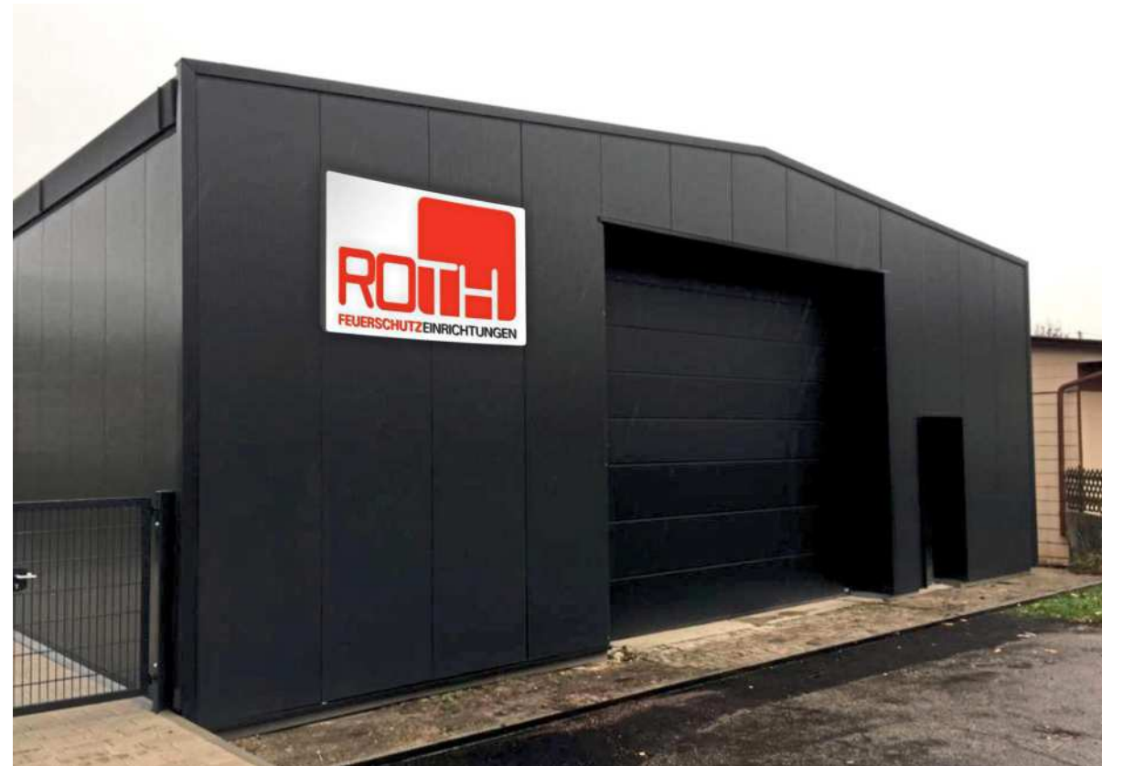
Um dem wachsenden Geschäft mit Abschottungen und Brandschutztüren und -toren gerecht zu werden, hat das Unternehmen 300.000 Euro in eine Halle in Altschweier an der Mattenmühle investiert.

ihn aber noch keine Minute. Sie fühlt sich wohl in der Branche, in der Firma und in Bühl.