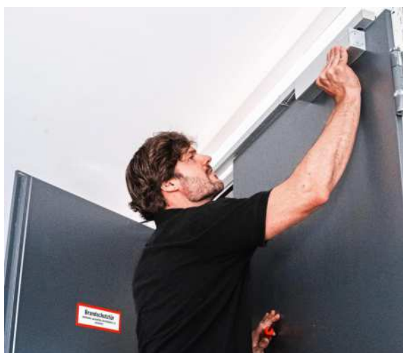
Die Mitarbeiter sind unter anderem Experten für Instandhaltung, Reparatur und den Einbau von Brandschutztüren.