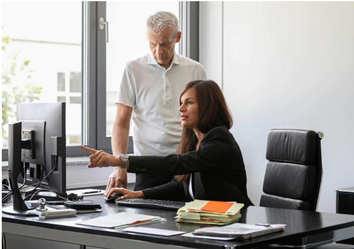
Vorausschauende Planung: Als Brandschutzexperte garantieren die Verantwortlichen individuelle Komplettlösungen, die ganz auf die Wünsche und Bedürfnisse der Kunden zugeschnitten sind.